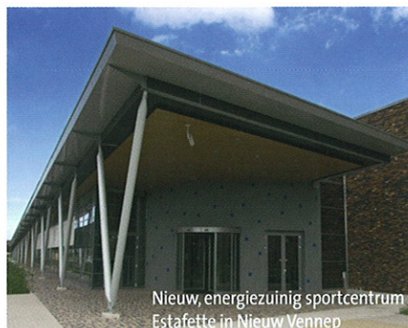
Nieuw, energiezuinig sportcentrum Estafette in Nieuw Vennep

De installaties van Ener-g Nedalo vinden hun weg naar vele bedrijven waaronder hotels (zoals Van der Valk en Hilton), zieken- en verzorgingshuizen (zoals het nieuwe Vlietland Ziekenhuis), universiteiten en scholen (zoals TU Delft), vliegvelden en militaire bases (zoals Schiphol en vliegbasis Gilze-Rijen), distributiecentra (zoals IKEA), tuinbouw (zoals Van der Linden), kantoren (zoals IBM Amsterdam) en de industrie (zoals Akzo).